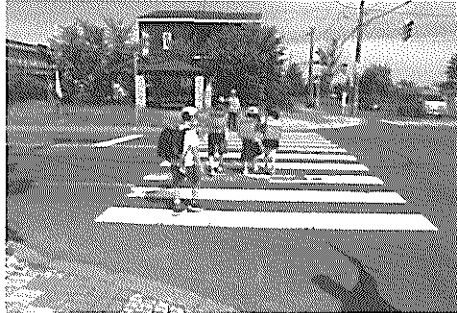
スクールガードによる早朝見守り(森林公園橋交差点)

全国の交通安全活動に連動したセフティコールの日(年4回)に「早朝街頭啓発活動」としての参加を中心に、自転車のマナー向上運動など、交通安全「母の会」などと連携し活動しています。本年度は「人と自転車にやさしいまちづくりの推進」をテーマに、手稲区や学校などの関係機関とも連携しながら、増加する自転車利用に対応した道路事情の把握とマナー向上活動等に取り組んでいきます。