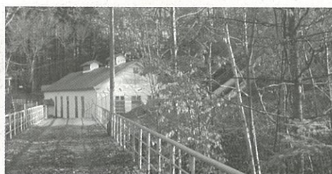
現在の漁川発電所

恵庭市街地を流れる漁川には二つの発電所があります。上流が恵庭発電所、下流は漁川発電所と言います。漁川発電所は大正11年に建設。当時、恵庭の人口は1,200世帯、7,000人ほどでしたが、これによって初めて恵庭村に文明の灯がともりました。この発電機は建設当時、江別から千歳川をさかのぼり漁太の船着き場に陸揚げされ、村民の手で運ばれたと言います。90年前に設置されたフランシスタービンは今も現役です。