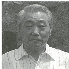
恵庭市町内会連合会会長

恵庭市町内会連合会は、町内会・自治会活動に必要な情報の提供や調査研究をおこない、明るく住みよいまちづくりを推進するため事業を展開しております。この広報誌をとおして、市民の皆さんに市町連の活動や市内の町内会・自治会を紹介し、市民と地域をつなぎ、町内会活動に興味をもっていた